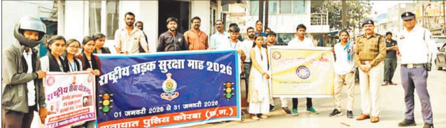
नुक्कड़ नाटक में शामिल छात्र व अन्य।