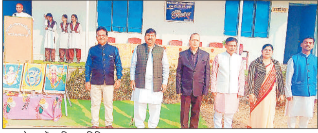
ध्वजारोहण में शामिल अतिथि व स्कूल स्टाफ।