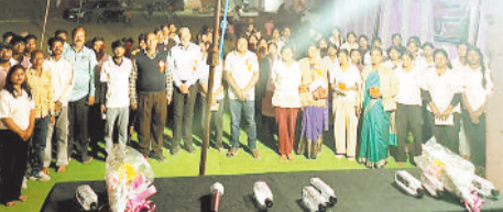
शिविर में शामिल रासेयों के स्वयं सेवक।