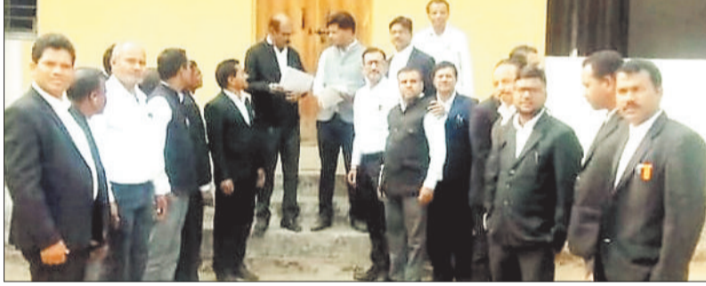
ज्ञापन सौंपते अधिवक्ता संघ के प्रतिनिधि।

हरिभूमि न्यूज ►► कटघोरा कटघोरा को जिला बनाए जाने की वर्षों पुरानी मांग एक बार फिर जोर पकड़ती नजर आ रही है। इसी कड़ी में कटघोरा जिला बनाओ अभियान समिति एवं अधिवक्ता संघ कटघोरा के प्रतिनिधिमंडल ने मुख्यमंत्री के नाम एसडीएम कटघोरा को ज्ञापन सौंपा। ज्ञापन के माध्यम से शासन से शीघ्र निर्णय लेकर कटघोरा को जिला घोषित करने की मांग की गई। अधिवक्ता संघ के पदाधिकारियों ने स्पष्ट किया कि यदि मांग पर सकारात्मक